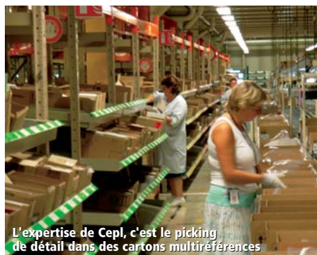
L'expertise de Cepl, c'est le picking de détail dans des cartons multiréférences

À l'instar de tout prestataire logistique, Cepl réceptionne les parfums et produits cosmétiques qui lui parviennent, les stocke, puis prépare les commandes et expédie les colis par camions. L'expertise de Cepl ? Le picking de détail dans des cartons multiréférences. Chacune de ses plates-formes logistiques recèle moult marques