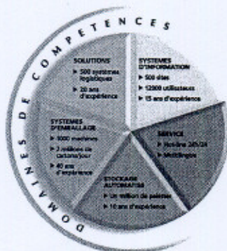
Les domaines de compétences de Savoye.

a-SIS accorde une place importante à l'accompagnement et à la formation des utilisateurs pilotes, des utilisateurs de terrain, des opérateurs chargés de la maintenance de l'application LM7®. "Nous pouvons notamment prendre en charge l'établissement des spécifications fonctionnelles et accompagner ensuite le passage en production et l'optimisation du produit pour permettre au client d'en obtenir toujours le maximum de performances", conduit Chantal Ledoux. ●