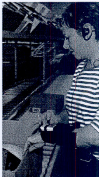
Solutions vocales "Voice Picker" développées par a-SIS.

Les modules complémentaires activables du progiciel accompagnent